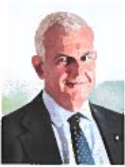
ALESSANDRO PROFUMO Amministratore Delegato Leonardo

Alessandro Profumo è Amministratore Delegato di Leonardo S.p.a. dal 16 maggio 2017.